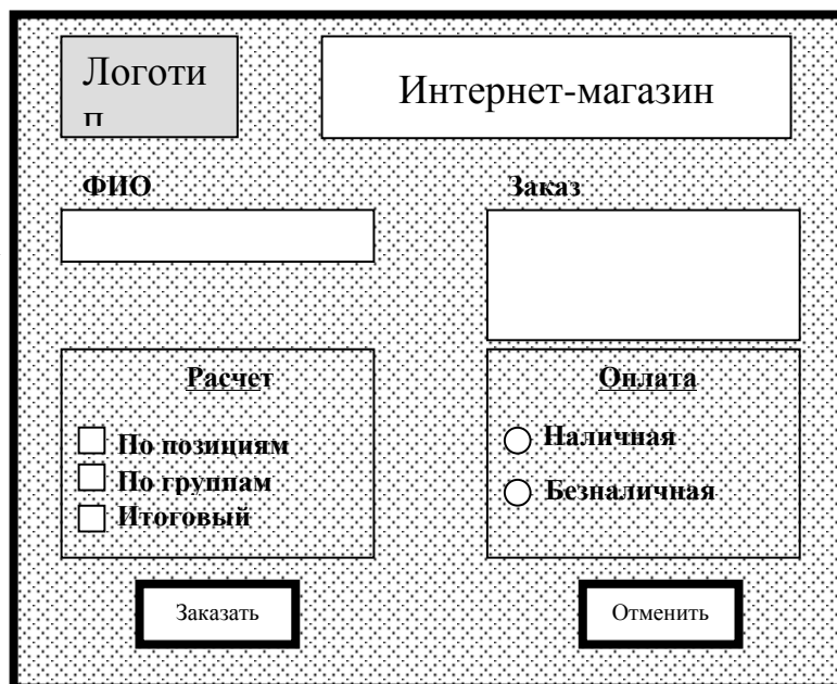
Рис. 2 Структура страницы «Гостевая»